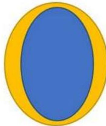
Stato di espansione

La figura indica in modo semplice l'interazione e la connessione tra i sistemi che la compongono. Il celeste è la componente fisiologica, il blu è la consapevolezza e il giallo il campo elettromagnetico esterno